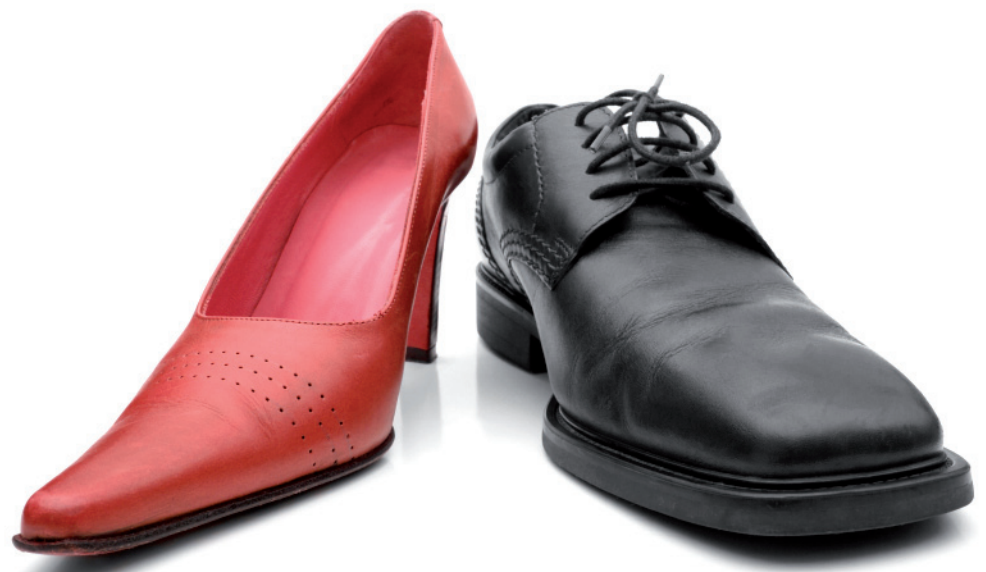
Abb.: Schwierige Gleichmacherei – auch in Versicherungstarifen!

Unter einem neuen Vertrag versteht die Kommission nicht nur Neuabschlüsse ab dem 21.12.2012, sondern auch individuelle Vertragsänderungen sowie die individuell vereinbarte Verlängerung bestehender Verträge. Vor dem Stichtag abgeschlossene Versicherungen sollten deshalb ab 2013 möglichst nicht mehr verändert werden.